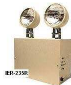
IER 235 Esquema y foto referencial